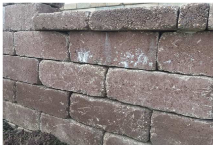
Vápenný výkvet na plote