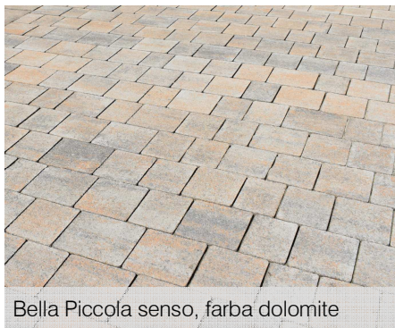
Bella Piccola senso, farba dolomite

Dosiahnutú kresbu colormixu pri výrobe samostatného prvku nie je možné porovnávať s tým istým colormixom pri inom výrobku v kombinovanej forme, resp. iného formátu.