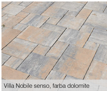
Villa Nobile senso, farba dolomite