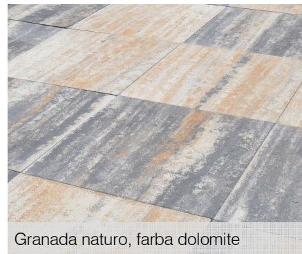
Granada naturo, farba dolomite

Odtieň dolomite v troch rôznych dlažbách – kresba colormixu sa líši v závislosti od povrchovej úpravy a od veľkosti jednotlivých formátov. Pokiaľ sa rovnako veľké plochy vyložia tromi rôznymi druhmi dlažieb v rovnakej farbe, výsledný efekt bude zakaždým odlišný.